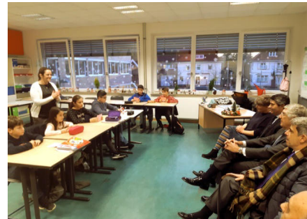
Visita ao curso EPE

Um exemplo da boa cooperação entre as autoridades locais, e os serviços consulares portugueses foi dado com a realização de uma permanência consular na Câmara Municipal de Cuxhaven. A deslocação de colaboradores do Consulado-Geral de Hamburgo permite o atendimento e a realização de atos consulares por parte de cidadãos portugueses residentes naquela localidade, evitando, assim, deslocações a Hamburgo. Nesta visita, José Luís Carneiro pôde ainda estabelecer contacto com alunos de língua portuguesa dos cursos ministrados pelo Instituto Camões naquela cidade.