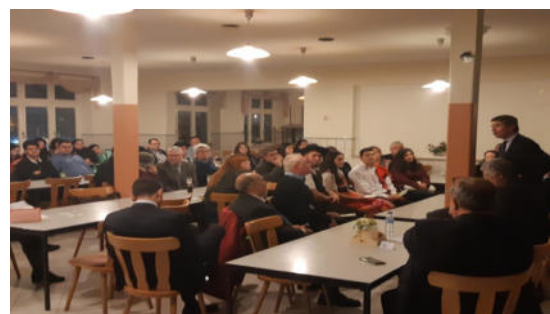
Diálogos com a Comunidade