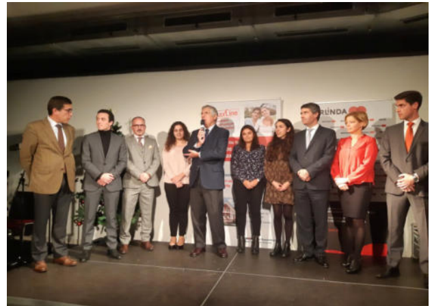
Entrega das bolsas de estudo

jovens luso-descendentes residentes na Alemanha no desenvolvimento dos seus estudos.