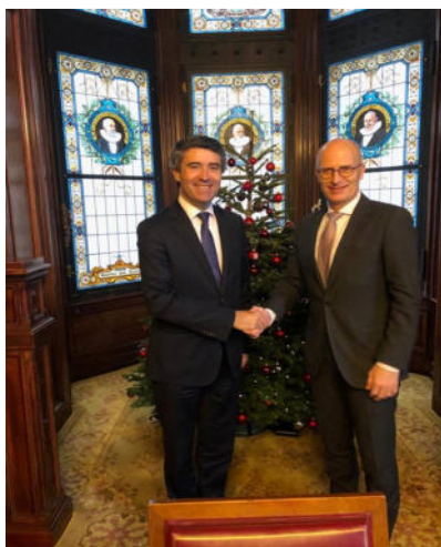
SECP com o Primeiro Burgomestre de Hamburgo

A 10 de dezembro passado, o Secretário de Estado das Comunidades Portuguesas, José Luís Carneiro, acompanhado pelo Embaixador de Portugal na Alemanha, João Mira Gomes, reuniu com o Primeiro-Burgomestre da Cidade-Estado de Hamburgo, Peter Tschentscher. José Luís Carneiro manifestou o interesse e a disponibilidade do Estado português em cooperar com as autoridades de Hamburgo no reforço do ensino do português naquela região, tanto como língua estrangeira como enquanto língua de herança. O Secretário de Estado enalteceu a boa cooperação entre as autoridades de Hamburgo e os serviços consulares portugueses naquela cidade.