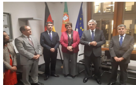
Inauguração das novas instalações do CG Hamburgo