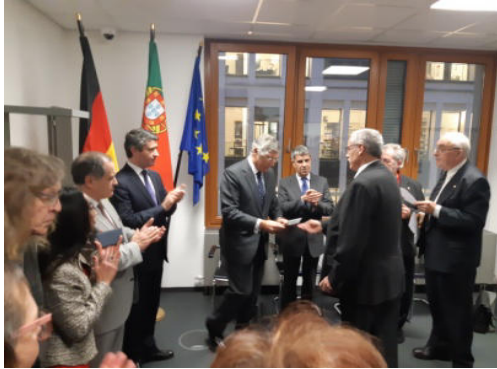
Cerimónia com a ADFA

Associação. O dia contemplou, também, uma visita à Missão Católica de Língua Portuguesa.