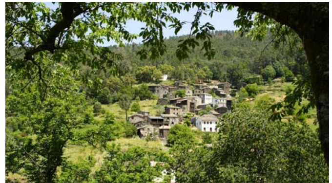
Aldeia de Candal

Neben dem Dark-Sky-Schutzgebiet am Alqueva-Stausee im Alentejo verfügt Portugal mit den Aldeias do Xisto seit neuestem auch über einen Sternpark in der Region Centro de Portugal. Das 27 Schieferdörfer umfassende Netzwerk wurde im Juli von der Starlight Foundation zur „Starlight Tourist Destination“ erklärt. Solche Reiseziele, in denen zum Schutz des Nachthimmels die Lichtverschmutzung kontrolliert wird, bieten nicht nur ideale Bedingungen für die Sternenbeobachtung, sondern verfügen auch über die nötige touristische Infrastruktur.